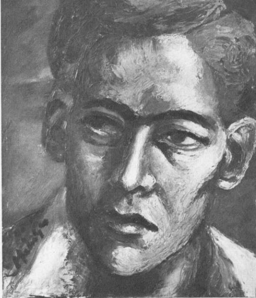
Kop van 'n Jong Man, 1945