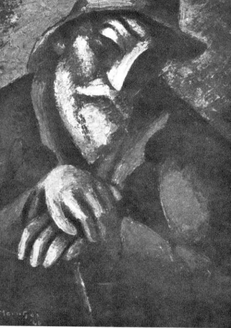
Ou Boer, 1946